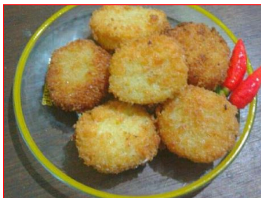
Foto nuget tanpa teknik fotografi

Workshop fotografi ini dilaksanakan dengan metode hands-on dimana para peserta dilibatkan secara aktif untuk belajar langsung teknik-teknik fotografi untuk foto produk. Peserta menggunakan kamera smartphone maupun camera pocket masing-masing dan membawa produk jualan yang mereka miliki. Gambar 1 adalah perbandingan hasil foto produk tanpa menggunakan teknik fotografi dan menggunakan teknik fotografi.