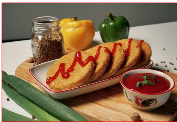
Foto nuget dengan teknik fotografi