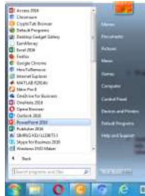
Gambar 3. Membuka Aplikasi Power Point