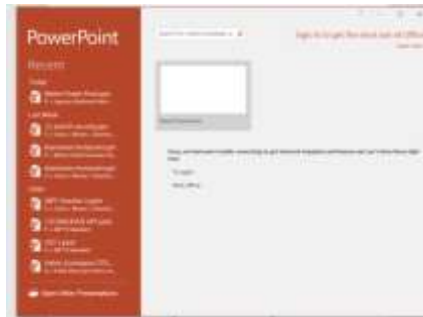
Gambar 4. Tampilan Awal Power Point