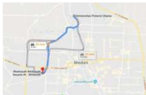
Gambar 2. Peta Lokasi Kegiatan Pengabdian

Pelaksanaan pengabdian masyarakat ini dilakukan pada sekolah MISAL-Ikhlasih Medan yang bergerak pada bidang pendidikan yang berlokasi di Jl. Beo No. 13, Sei Sikambing B, Kec. Medan Sunggal, Kota Medan, Sumatera Utara. Tempat tersebut dapat ditempuh dalam waktu kurang lebih