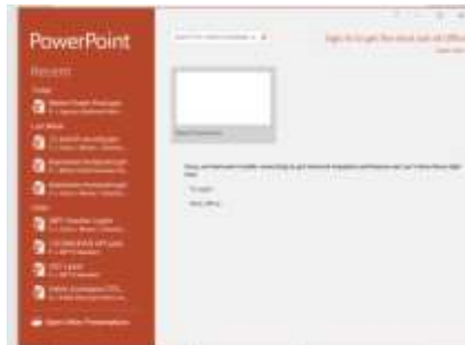
Gambar 4. Tampilan Awal Power Point