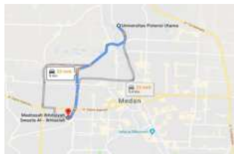
Gambar 2. Peta Lokasi Kegiatan Pengabdian

Pelaksanaan pengabdian masyarakat ini dilakukan pada sekolah MISAL-Ikhlasih Medan yang bergerak pada bidang pendidikan yang berlokasi di Jl. Beo No. 13, Sei Sikambing B, Kec. Medan Sunggal, Kota Medan, Sumatera Utara. Tempat tersebut dapat ditempuh dalam waktu kurang lebih