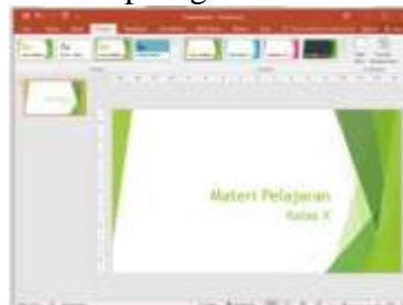
Gambar 6. Slide dengan Background pilihan