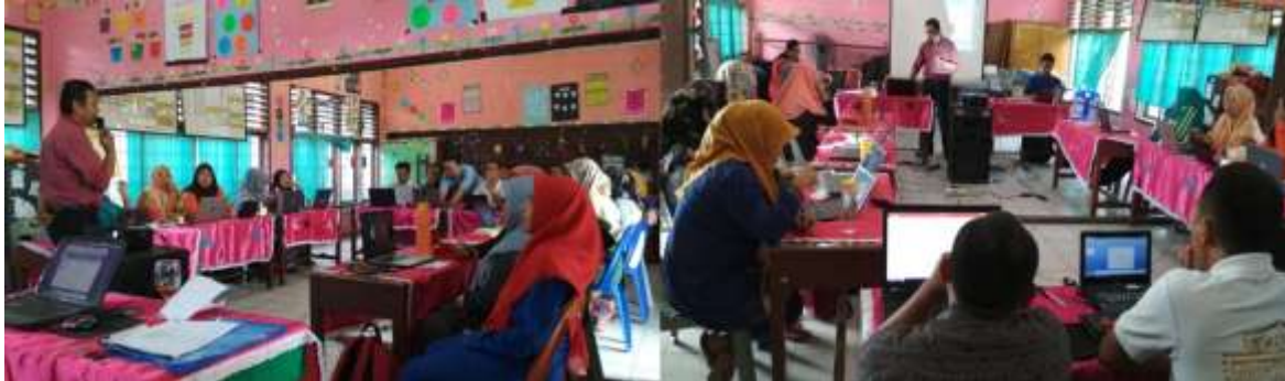
Gambar 15. Foto-Foto Kegiatan Pengabdian Kepada Masyarakat

Dokumentasi kegiatan pengabdian pada MISAI-Ikhlasiah Medan berupa foto kegiatan pelaksanaan pelatihan yang dilaksanakan pada ruang kelas sekolah.