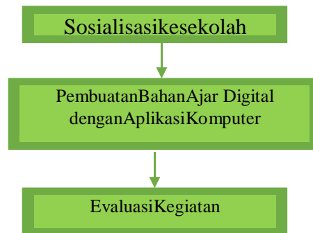
Gambar 1. Alur Kegiatan Abdimas

Tahapan- tahapan yang dilakukan untuk melaksanakan kegiatan pengabdian kepada masyarakat di MISAL-Ikhlasih Medan adalah sebagai berikut: