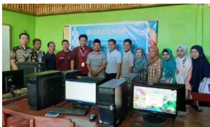
Gambar 3. Foto bersama beberapa Peserta dengan Tim Abdimas