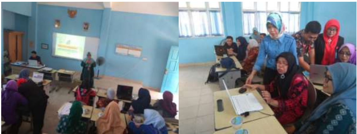
Gambar 3 . Pelaksanaan Kegiatan PKM

Pelaksanaan kegiatan dimulai dengan terlebih dahulu melakukan pertemuan dengan kepala sekolah Sekolah Dasar Negeri 170 Palembang. Kemudian bersama-sama menuju ketempat pelaksanaan kegiatan. Kegiatan pelatihan dimulai setelah Kepala Sekolah membuka secara resmi kegiatan pelatihan dan memperkenalkan siapa saja yang mengisi acara dalam kegiatan pengabdian tersebut. Untuk materi sendiri dimulai dengan menyampaikan pengenalan mengenai Microsoft office 2010 kemudian menyampaikan secara singkat fitur yang ada di masing-masing aplikasi Microsoft office 2010 , kemudian menyampaikan materi yang telah disiapkan sebelumnya. Terakhir adalah dengan memberikan latihan soal mengenai materi yang telah disampaikan.