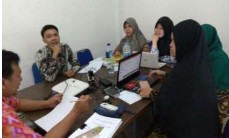
Gambar 2 . Meeting Persiapan Kegiatan PKM

Pada tahapan ini terlebih dahulu tim melakukan pertemuan untuk membahas segala hal yang berkaitan dengan kegiatan pengabdian yang dilakukan kemudian menyiapkan peralatan yang dibutuhkan baik dari segi software maupun hardware . Serta pembagian tugas saat penyampaian materi dan tugas dari tiap-tiap tim pelaksana kegiatan pengabdian kepada masyarakat di Sekolah Dasar Negeri 170 Palembang.