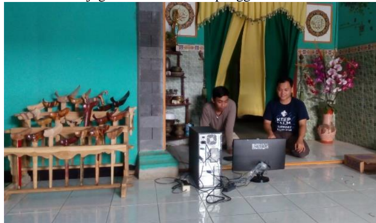
Gambar 3. Kegiatan Pelatihan Komputer

Pelatihan komputer meliputi dasar penggunaan komputer, instalasi komponen-komponen komputer, dan pengelolaan website. Selain website juga memaksimalkan penggunaan media sosial facebook.