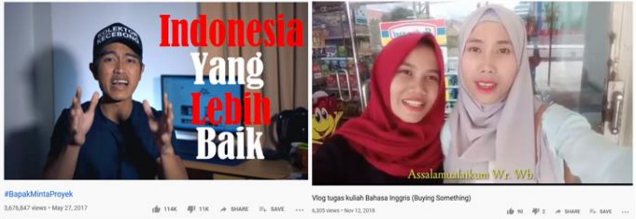
Gambar 4 Contoh Video Blog (vlog)

memiliki subscriber terbanyak di Asia Tenggara, yaitu lebih dari 17 juta orang. Tipe konten vlog dari Atta Halilintar berisi vlog kehidupan pribadi sehari-hari. Jadi dapat disimpulkan bahwa dengan memiliki vlog, seorang pengguna dapat dikenal dan memberikan nilai secara ekonomis bagi pemilik akun. Masih pada gambar 1 di atas (grafik), konten vlog memiliki jumlah subscriber terbanyak dari jenis konten lain seperti musik, game, teknolo, kuliner dan lain-lain. Data ini memberikan gambaran bahwa vlog banyak disukai orang dan bahkan sudah menjadi konten yang sangat populer di Indonesia. Vlog memberikan konten yang lebih kaya dibandingkan dengan blog yang kontennya hanya dalam bentuk teks dan gambar. Vlog mengkombinasikan konten video, suara, gambar dan teks. Konten seperti ini memungkinkan pengguna menjadi lebih bisa mengeksplorasi berbagai cara baru dalam berkomunikasi. Pengguna merasa yakin bahwa video dapat menghasilkan ekspresi yang lebih baik dan alami dari teks (gambar 4 contoh vlog).