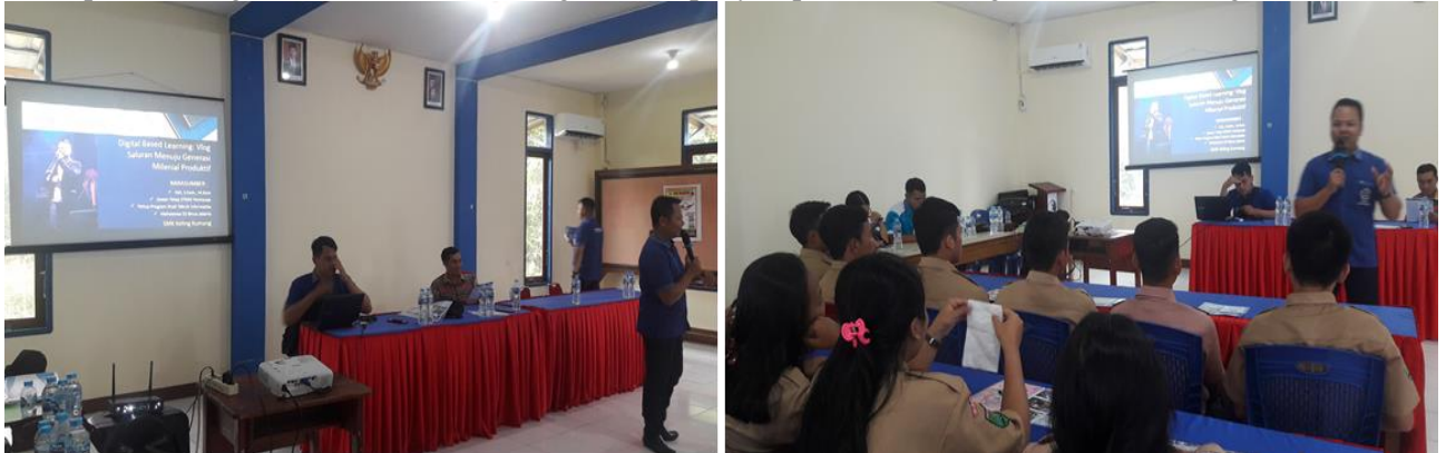
Gambar 2 Penyampaian Materi Digital Based Learning

Para guru dan siswa dibekali dengan pengetahuan peran digital dalam mendukung kegiatan belajar antara guru dan siswa. Di era digital seperti sekarang ini, terutama di SMK Keling Kumang sebagai salah satu sekolah kejuruan yang ada di Kabupaten Sekadau, kualifikasi guru jelas menjadi hal yang mesti dipersiapkan dengan baik. Ketersediaan sarana dan prasarana yang mendukung dalam pelaksanaan pembelajaran digital adalah hal yang sangat baik, namun guru harus tetap mendapatkan pengetahuan yang cukup agar punya kompetensi dan kualifikasi yang mampu dalam menjalankan berbagai metode atau strategi pembelajaran berbasis digital. Melalui teknologi digital, siswa juga harus punya kemampuan untuk memanfaatkannya dalam merangsang semangat belajar dan terutama agar bisa menjadi generasi milenial yang produktif. Salah satu bentuk pembelajaran yang inovatif dan telah terbukti memberikan nilai positif bagi siswa adalah memberikan materi pelajaran berbasis video. Siswa juga dapat mengerjakan tugas dan memapar hasil tugas dalam bentuk video (gambar 2 penyampaian materi digital based learning).