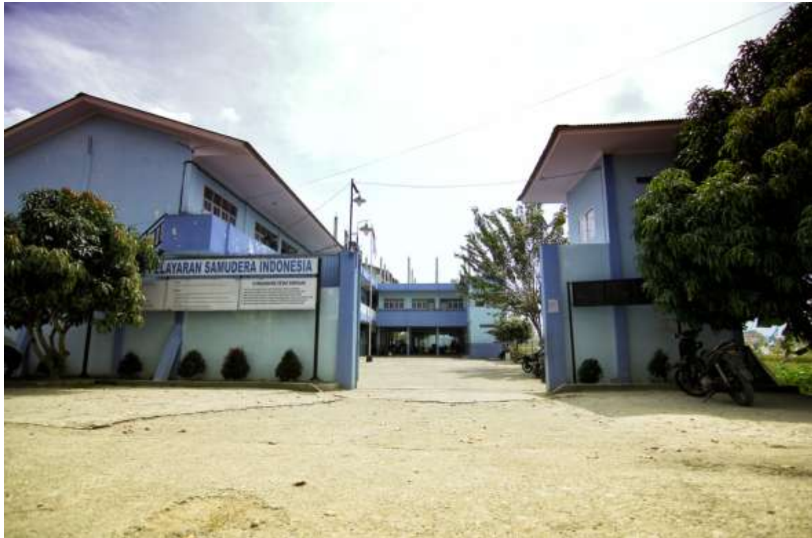
Gambar 2 SMK Pelayaran Samudera Indonesia - Medan