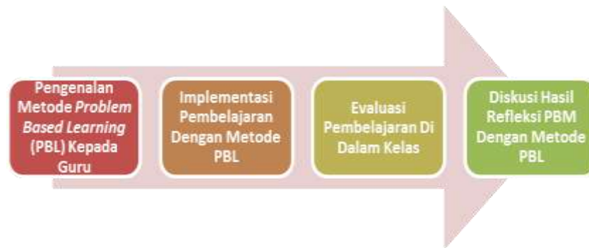
Gambar 1. Prosedur Kerja PKM