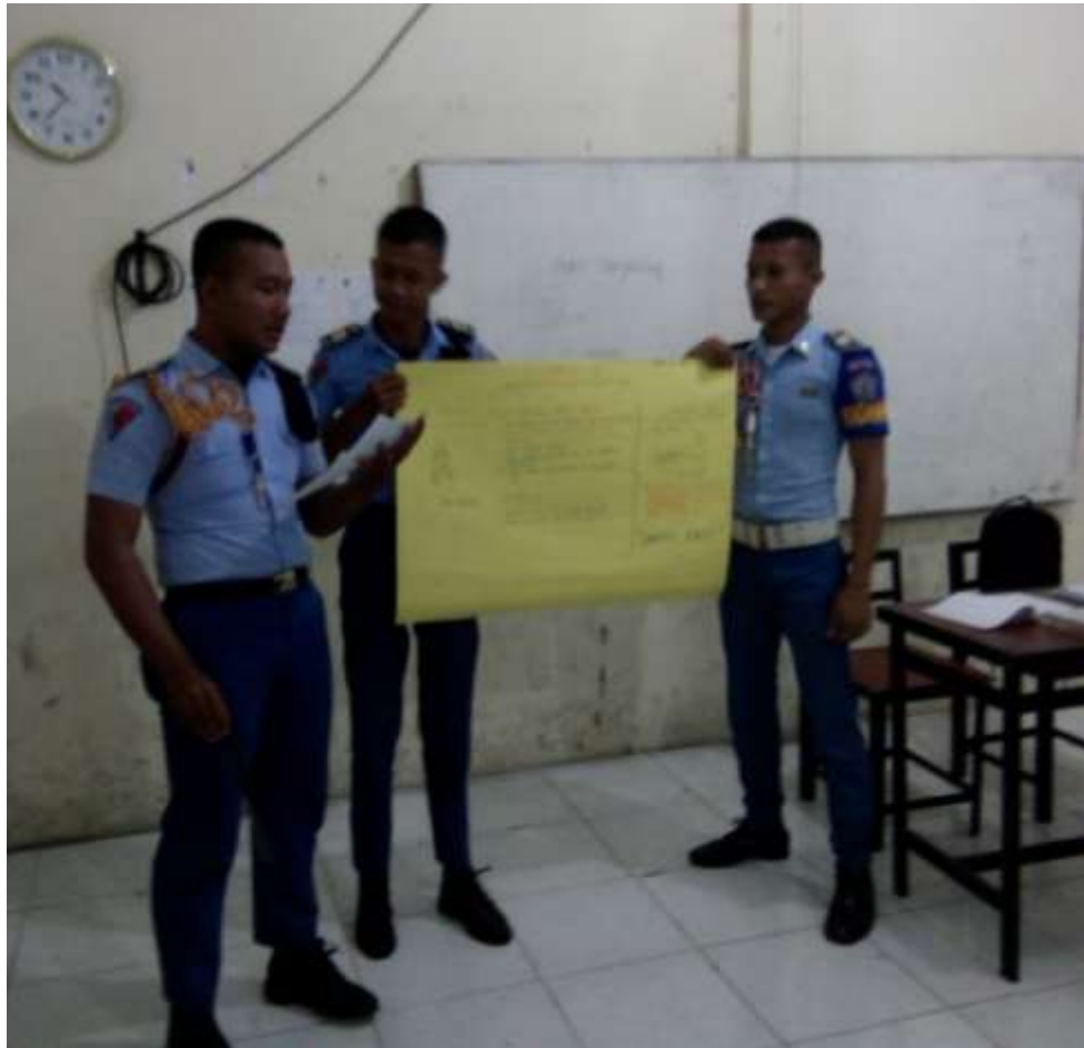
Gambar 3. Presentasi Skema Penyelesaian Masalah

Gambar 3 menunjukkan kemampuan taruna untuk menjelaskan kembali penyelesaian masalah yang mereka berikan terhadap permasalahan yang diajukan oleh guru. Masing-masing anggota kelompok memiliki peran masing-masing di dalam alur skema penyelesaian masalah tersebut.