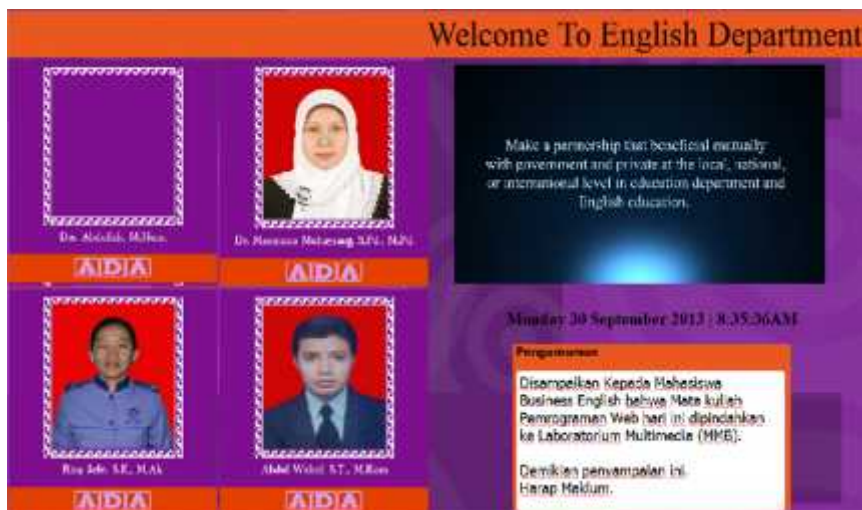
Gambar 5. Tampilan interface Digital Signage

Tampilan diatas sudah sesuai dengan apa yang telah dirancang sebagai user interface dari digital signage ini. Terdapat tampilan data dosen yang dilengkapi dengan Foto, Nama lengkap dan status keberadaan dosen dikampus apakah ada atau sementara tidak ada. Selain itu sudah ada video visi – misi semua prodi jurusan Bahasa Inggris yang menarik yang telah dibuat dengan aplikasi After effect CS4, juga ada tampilan tanggal dan Jam serta tampilan pengumuman yang mungkin diperlukan oleh civitas akademika jurusan Bahasa Inggris.