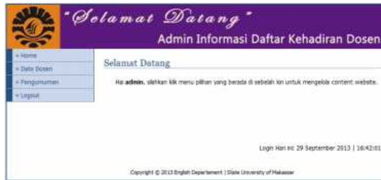
Gambar 7. Halaman utama Admin

Pada halaman utama tersebut, terdapat empat halaman yaitu halaman home, halaman Data Dosen, Halaman Pengumuman dan Halaman logout. Halaman home adalah halaman utama yang berisi informasi dan ucapan selamat datang pada sistem ini. Halaman data dosen adalah halaman yang berisi Daftar dosen. Pada Halaman data dosen ini, kita bisa melakukan tiga hal yaitu, Tambah Dosen yang berfungsi untuk menambahkan dosen manakala ada dosen lain atau dosen baru yang akan dimasukkan pada sistem. Isi dari halaman tambah dosen ini adalah Nama Lengkap Dosen, status dosen apakah ada atau sedang keluar, Gambar Dosen kalau sementara ada dan Gambar kalau dosen lagi keluar. Fotonya bisa di browse dan dicari letaknya pada komputer kita. Selanjutnya ada dua tombol dibagian bawah. Tombol simpan untuk menyimpan data, sedangkan tombol Batal untuk membatalkan data yang sudah kita isi sebelumnya.