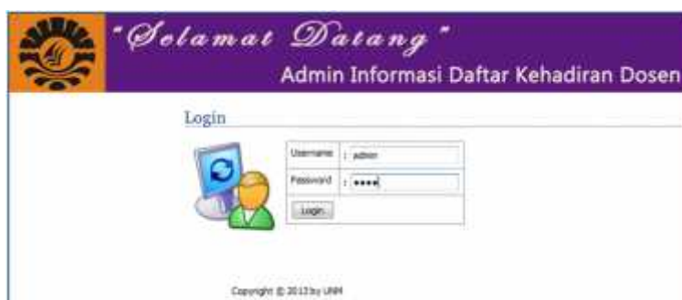
Gambar 6. Tampilan awal Halaman Admin

Saat masuk kehalaman admin, diberikan autentikasi dan verifikasi user terlebih dahulu. Hal ini ditujukan untuk security dari sistem itu sendiri sehingga tidak semua orang yang tidak berkepentingan bisa mengakses sistem ini. Yang bisa mengakses sistem ini adalah mereka yang sudah memiliki user name dan password saja. Berikut adalah tampilan awal dari halaman admin :