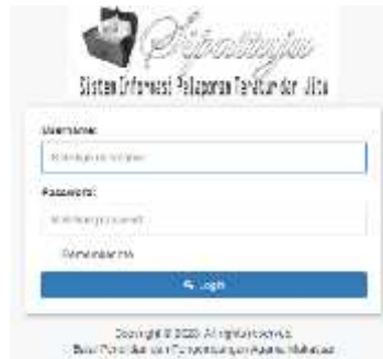
Gambar 1. Halaman Login

Gambar 1 di atas merupakan halaman yang digunakan untuk melakukan autentikasi pengguna dengan pengisian username dan password .