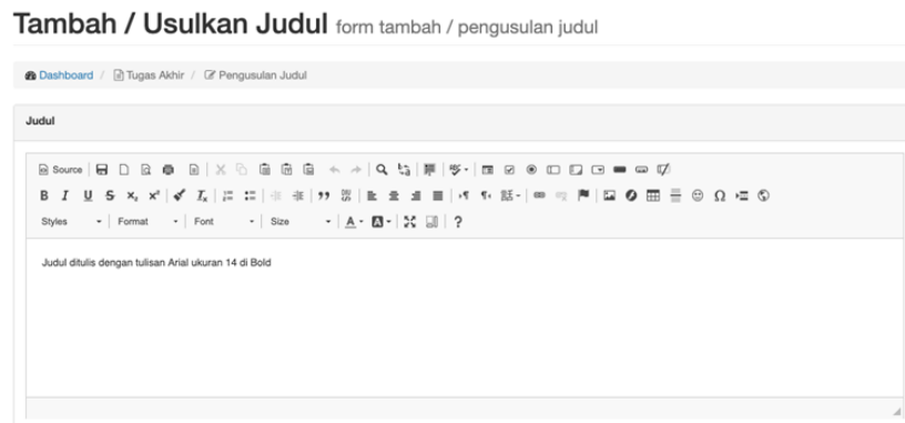
Gambar 3. Pengajuan Judul Skripsi

Gambar 3 menunjukkan halaman yang digunakan untuk menulis judul skripsi beserta ringkasan penelitian.