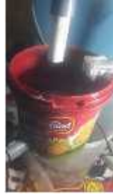
Gambar 7. Simulasi Kondisi Air Tandon Penuh

Pada gambar 7 terlihat air berada di posisi 100% atau sekitar 3cm sehingga sensor ketinggian mendeteksi tingkat ketinggian air yang penuh, pada kondisi ini data ketinggian akan di kirim ke thingspeak sehingga data bisa di pantau melalui aplikasi.