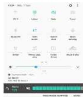
Gambar 11 Notifikasi yang terkirim ke handphone

Pada gambar 10 terlihat jelas kondisi kapan dalam keadaan air bersih, air sedikit keruh dan air keruh.