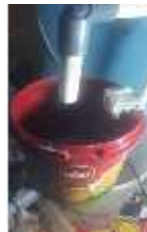
Gambar 9. Simulasi Kondisi air tandon habis

Pada gambar 8 terlihat tampilan air di tandon penuh dan Grafik Ketinggian air berada dibawah, serta terdapat monitoring ketinggian air, yang berarti ketinggian air tandon 2cm atau sekitar 100%.