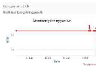
Gambar 8. Tampilan pada aplikasi pada ketinggian air penuh

Pada gambar 7 terlihat air berada di posisi 100% atau sekitar 3cm sehingga sensor ketinggian mendeteksi tingkat ketinggian air yang penuh, pada kondisi ini data ketinggian akan di kirim ke thingspeak sehingga data bisa di pantau melalui aplikasi.