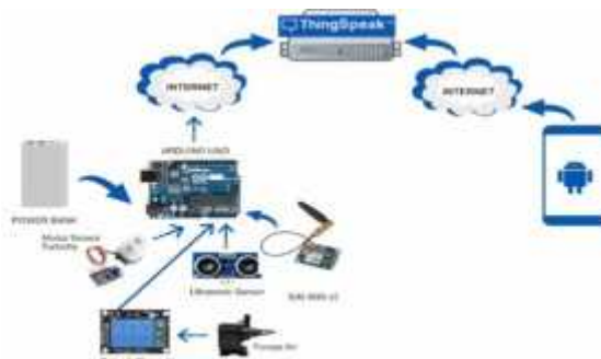
Gambar 3. Arsitektur Perancangan Sistem

Analisis Arsitektur Sistem merupakan sistem yang akan dibangun, untuk sistem monitoring kekeruhan air dan ketinggian air berbasis IoT akan berkomunikasi dengan Arduino UNO yang akan terhubung dengan ThingSpeak untuk menyimpan dan mengambil data dari hal-hal menggunakan protokol HTTP dan MQTT melalui Internet atau melalui Local Area Network. Prinsip kerja dari alat yang akan dibangun dapat dijelaskan pada gambar 3.