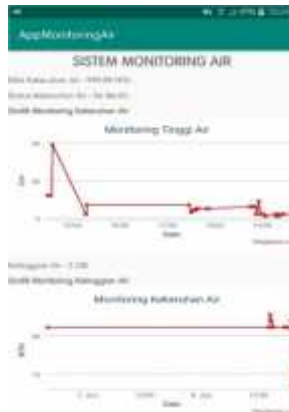
Gambar 6. Halaman Utama Aplikasi

Pada halaman utama aplikasi ini, pengguna bisa melihat / monitoring kekeruhan air dan ketinggian air, serta dapat melihat status kekeruhan air dengan kondisi tertentu, dan pengguna dapat melihat data melalui grafik kekeruhan dan ketinggian air secara real-time ketika alat sedang digunakan. Hal ini sangat berguna bagi petugas penyediaan air bagi kawasan perumahan untuk melakukan tindakan secepatnya jika ada hal-hal yang tidak diinginkan, semisal tingkat kekeruhan air yang meningkat ataupun gangguan pada pompa air sehingga ketinggian air tidak ada penambahan yang dapat mengakibatkan kekosongan pada tempat penampungan air.