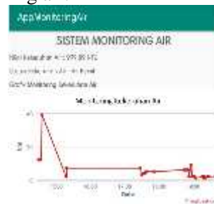
Gambar 10. Riwayat Grafik monitoring kekeruhan air

Pada menu ini kondisi air yang di pantau oleh sensor ultrasonic dan Turbidity akan di kirim secara otomatis ke thingspeak melalui arduino menggunakan SIM8001 , data tersebut akan di tampilkan dalam riwayat monitoring air.