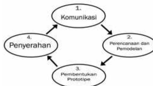
Gambar 2. Konseptual Penelitian

Pada Gambar 2 terdapat empat tahapan yang digunakan dalam melakukan pengembangan aplikasi pengiriman informasi pemadaman listrik berbasis SMS Gateway di area Tanggari Rayon Airmadidi.