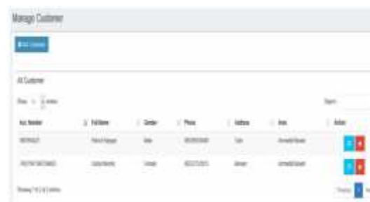
Gambar 5. Form Implementasi Antarmuka Manage Customer

Pada gambar 4 form Implementasi Antarmuka Add Customer menunjukkan login yaitu apabila kita mau masuk ke system maka harus input dulu username dan password, apabila salah masukan maka akan diulang lagi untuk login.