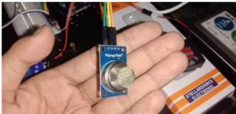
Gambar 2 Sensor MQ-135

Tahapan pertama dilakukan penghubungan antara sensor MQ-135 dengan Wemos D1 ESP8266. Pastikan A0 terhubung dengan benar, agar sensor dapat mengirimkan data yang diterimanya dan mengirimnya ke Wemos D1 8266.