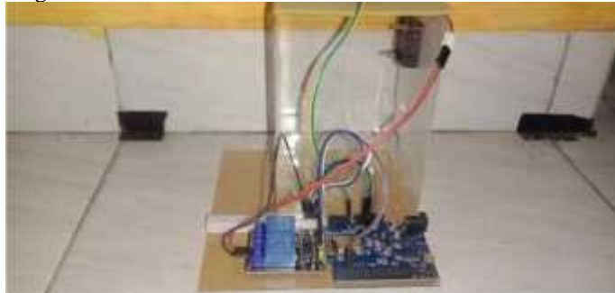
Gambar 6 Hasil Rangkaian Hardware

Pada tahapan ini merupakan hasil dari perangkaian komponen – komponen alat pendeteksi asap rokok yang tertera pada gambar 6.