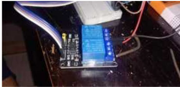
Gambar 5 Relay 2 Kaki

Pada relay ini mampu untuk menghantarkan listrik sebesar 220v. Relay ini memiliki 2 kaki namun yang digunakan hanya 1 kaki.