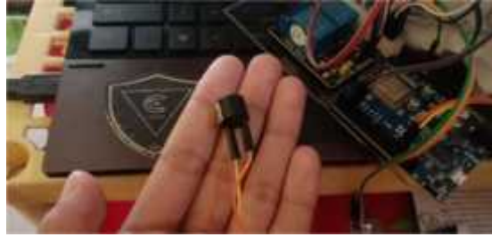
Gambar 4 Buzzer