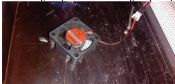
Gambar 3 Kipas DC

Tahapan kedua dilakukan penghubungan antara kipas DC dengan relay. Pastikan pin NO1 terhubung dengan benar dengan kipas DC dan COM1 agar kipas dapat menyala.