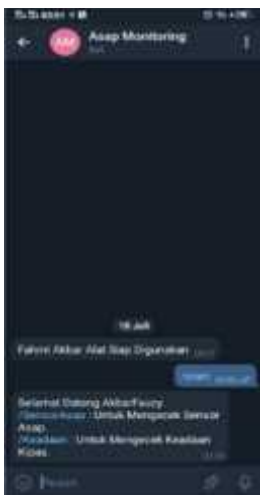
Gambar 8 Tampilan Menu Monitoring

Pada tampilan ini terdapat pilihan untuk mengecek keadaan sensor dan kipas DC.