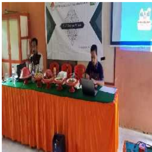
Gambar 4.1 Pembukaan Kegiatan

b. Pelaksanaan kegiatan, peserta dibagikan modul kegiatan untuk memaksimalkan pemberian materi dan dipandu oleh 2 orang mentor dosen, dan 3 orang mahasiswa.