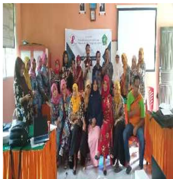
Gambar 4.4 Foto bersama peserta pelatihan

e. Menutup Kegiatan pengabdian disertai foto bersama para peserta pelatihan