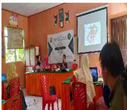
Gambar 4.2 Pelaksanaan Kegiatan

b. Pelaksanaan kegiatan, peserta dibagikan modul kegiatan untuk memaksimalkan pemberian materi dan dipandu oleh 2 orang mentor dosen, dan 3 orang mahasiswa.