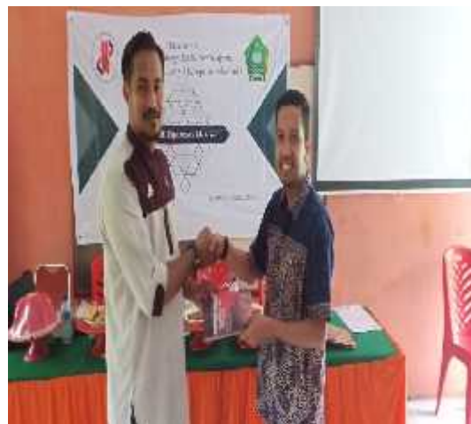
Gambar 4.3 Pemberian cendra mata

d. Pemberian cendra mata kepada bapak kepala sekolah MIS Karama.