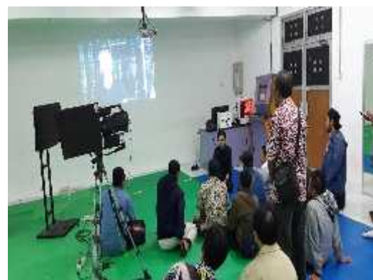
Gambar 8 Peserta Menampilkan hasil aplikasi yang telah dibuat

Finalisasi Hasil Aplikasi Augmented Reality Dalam materi ini para peserta diminta untuk menampilkan hasil dari aplikasi yang telah dibuat, kemudian dibandingkan dengan hasil dari peserta lainnya. Setiap hasil yang dibuat kemudian di evaluasi langkah-langkah pembuatan beserta saran agar aplikasi Augmented Reality bisa berjalan dengan baik disesuaikan dengan perangkat smartphone yang digunakan.