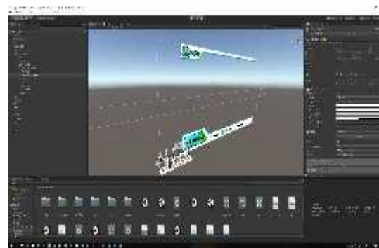
Gambar 7. Proses pembuatan tampilan halaman mulai

marker. Penempatan objek 3D harus didalam objek marker sehingga ketika kamera diarahkan pada marker maka objek 3D akan muncul. Selanjutnya membuat canvas untuk menempatkan button home dan menyesuaikan letak buttonnya.