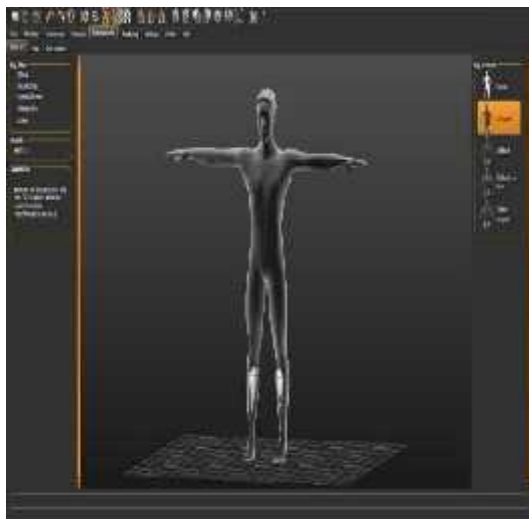
Gambar 5. Membuat skeleton atau tulang pada karakter.