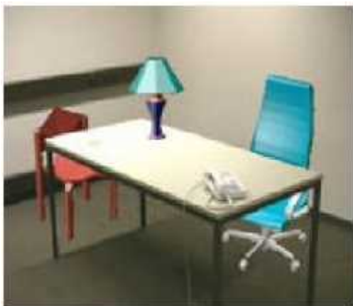
Gambar 1. Contoh AR dengan kursi virtual dan lampu virtual [5]

AR merupakan teknologi menggunakan overlay dengan grafik komputer yang ada dunia nyata yang dapat mendefinisikan bidang serta dapat menjelaskan banyak masalah dari sebuah objek. [5]. AR dapat didefinisikan sebagai sistem yang memenuhi tiga fungsi dasar: kombinasi objek nyata dan virtual, interaksi real-time, dan penggunaan 3D yang menyertainya[6].