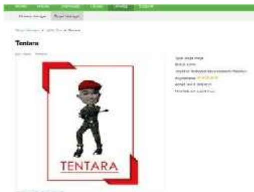
Gambar 6. Hasil Marker yang akan digunakan

Pada materi ini para peserta membuat marker yang digunakan sebagai gambar target untuk objek dalam Augmented Reality.