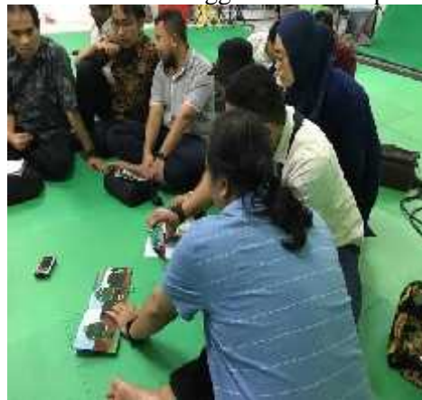
Gambar 4. Peserta Pelatihan mensimulasikan teknologi Augmented Reality dengan Menggunakan Kamera Smart Phone

Pengenalan Teknologi Augmented Reality Pada materi ini, peserta pelatihan diajarkan apa dan bagaimana Augmented Reality bekerja. Para peserta diberikan teori dasar pengenalan teknologi Augmented Reality serta simulasi menggunakan smartphone .