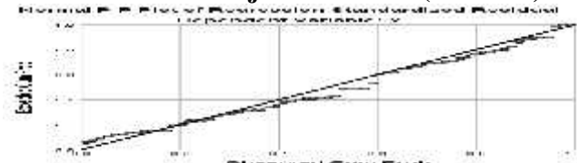
Gambar 6 Hasil Uji Normalitas (P-P Plot)

Berikut tabel hasil uji normalitas menggunakan P-Plot: