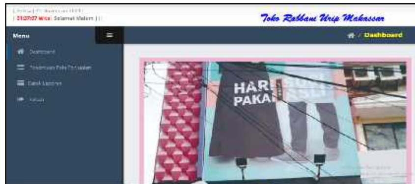
Gambar 12. Form halaman utama pimpinan