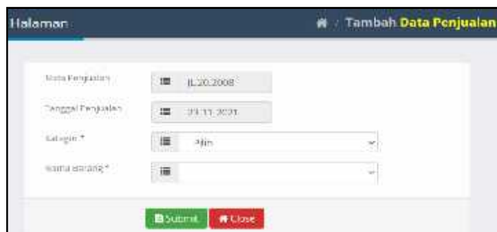
Gambar 9. Form data penjualan

Pengujian form data penjualan untuk menguji apakah form data penjualan layak untuk diimplementasikan sesuai dengan yang diharapkan. Bentuk form data penjualan seperti gambar 9.