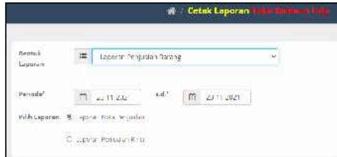
Gambar 10. Form cetak laporan

Pengujian form cetak laporan untuk menguji apakah form cetak laporan layak untuk diimplementasikan sesuai dengan yang diharapkan. Bentuk form cetak laporan seperti gambar 10.