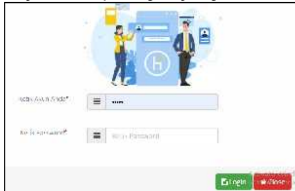
Gambar 2. Form login

Pengujian form login untuk menguji apakah form login layak untuk diimplementasikan sesuai dengan yang diharapkan. Bentuk form login seperti gambar 2.