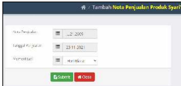
Gambar 7. Form data nota penjualan