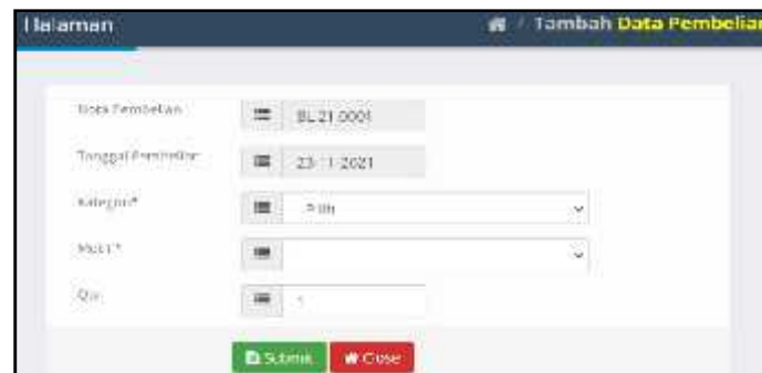
Gambar 8. Form data pembelian

Pengujian form data pembelian untuk menguji apakah form data pembelian layak untuk diimplementasikan sesuai dengan yang diharapkan. Bentuk form data pembelian seperti gambar 8.