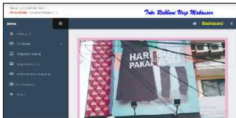
Gambar 11. Form halaman utama admin

Pengujian form halaman utama admin untuk menguji apakah form halaman utama admin layak untuk diimplementasikan sesuai dengan yang diharapkan. Bentuk form halaman utama admin seperti gambar 11.