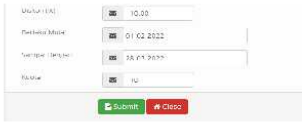
Gambar.5. Form setup diskon

Dari gambar diatas menampilkan manfaat dari form setup diskon yaitu untuk mengatur berapa diskon yang ingin diberikan,tanggal mulai berlaku sampai batas berlakunya diskon, dan berapa kuota yang diberikan