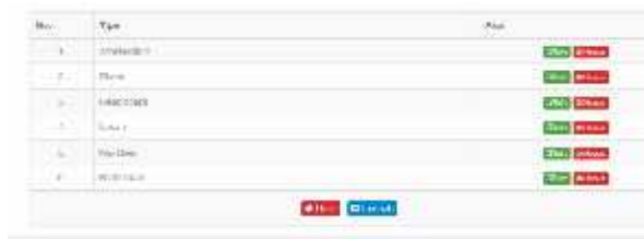
Gambar.7. Form tipe Spring Bed

Dari gambar diatas menampilkan manfaat dari form tipe Spring Bed yaitu untuk menghapus, menambah dan mengedit data tipe Spring Bed