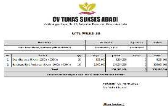
Gambar.13.Out put nota penjualan