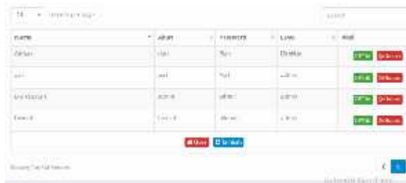
Gambar.6. Form data admin

Dari gambar diatas menampilkan manfaat dari form data admin yaitu untuk menghapus, menambah dan mengedit data admin