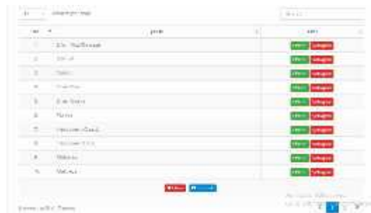
Gambar.8. Form jenis Spring Bed

Dari gambar diatas menampilkan manfaat dari form jenis Spring Bed yaitu untuk menghapus, menambah dan mengedit data jenis Spring Bed