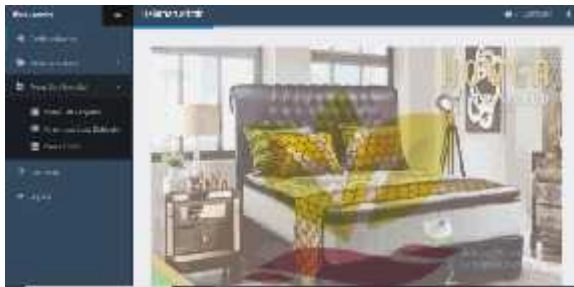
Gambar.11. Tampilan fitur data transaksi

Dalam menu data transaksi terdapat berbagai fitur yang berfungsi sebagai berikut: