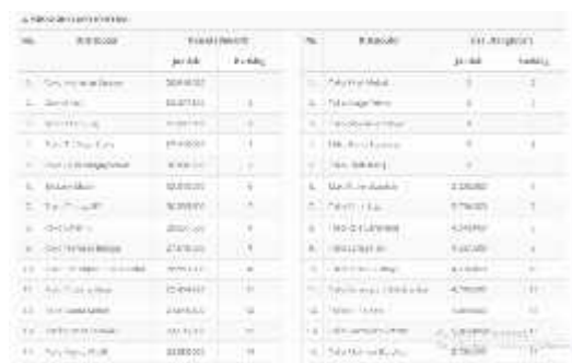
Gambar.15. Perangkingan kriteria

Dari gambar diatas menampilkan manfaat dari tabel keputusan distributor yaitu untuk menampilkan data distributor meliputi 3 kriteria penilaian