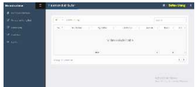
Gambar 21. Form daftar utang

Dari gambar diatas menampilkan manfaat dari form daftar utang yaitu untuk menampilkan daftar utang setelah admin cetak nota