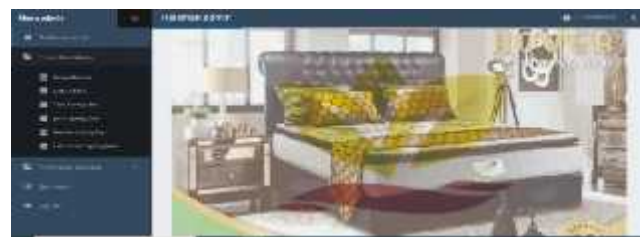
Gambar.4. Tampilan fitur data master

Tampilan menu admin merupakan tampilan awal setelah login sebagai admin. Dari gambar diatas terlihat beberapa menu dimana diantaranya adalah a..Proses data master Dalam proses data master terdapat beberapa fitur seperti gambar dibawah ini: