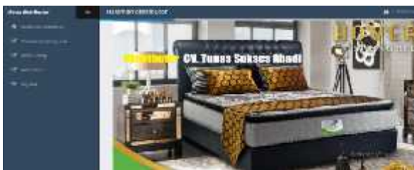
Gambar 19. Tampilan menu distributor

Tampilan menu distributor merupakan tampilan awal setelah login sebagai distributor. Dari gambar