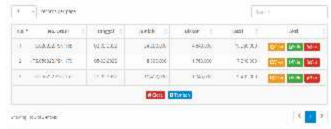
Gambar 20 Form pemesanan Spring Bed

Dari gambar diatas menampilkan manfaat dari form pemesanan Spring Bed yaitu untuk view, cut, menambah dan mengedit pemesanan Spring Bed