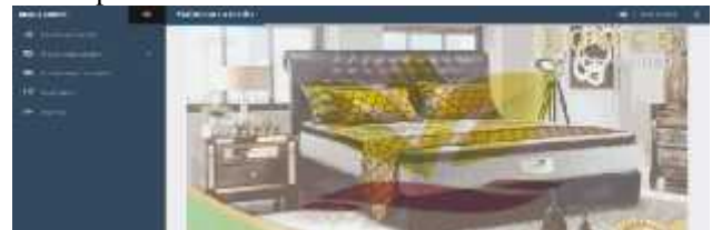
Gambar.3. Tampilan form menu admin

Tampilan menu admin merupakan tampilan awal setelah login sebagai admin. Dari gambar diatas terlihat beberapa menu dimana diantaranya adalah a..Proses data master Dalam proses data master terdapat beberapa fitur seperti gambar dibawah ini: