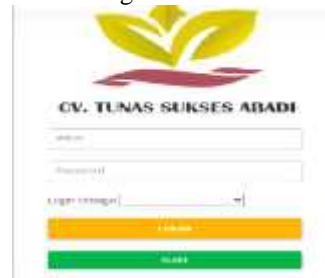
Gambar.2. Form login

Tampilan form login merupakan tampilan awal sebelum masuk ke sistem.