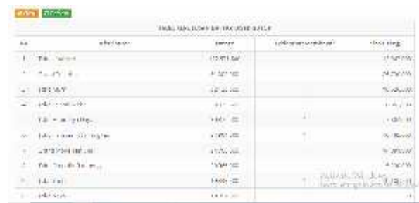
Gambar.14.Keputusan daftar distributor

Dari gambar diatas menampilkan manfaat dari tabel keputusan distributor yaitu untuk menampilkan data distributor meliputi 3 kriteria penilaian