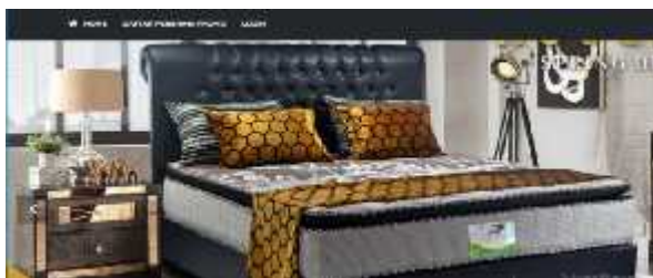
Gambar.1. Tampilan awal