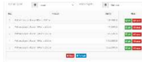
Gambar.9. Form produk Spring Bed

Dari gambar diatas menampilkan manfaat dari form produk Spring Bed yaitu untuk menghapus, menambah dan mengedit data produk Spring Bed.