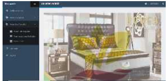
Gambar.11. Tampilan fitur data transaksi

Dalam proses data transaksi terdapat beberapa fitur seperti gambar dibawah ini: