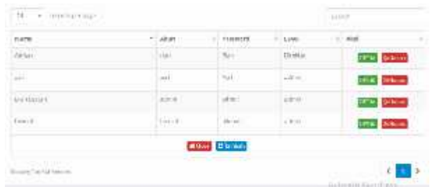
Gambar.6. Form data admin

Dari gambar diatas menampilkan manfaat dari form data admin yaitu untuk menghapus, menambah dan mengedit data admin