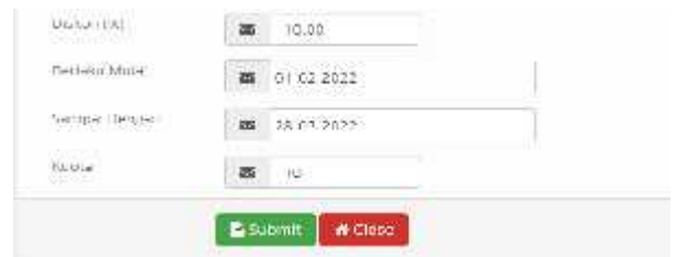
Gambar.5. Form setup diskon

Dari gambar diatas menampilkan manfaat dari form setup diskon yaitu untuk mengatur berapa diskon yang ingin diberikan, tanggal mulai berlaku sampai batas berlakunya diskon, dan berapa kuota yang diberikan