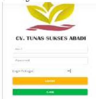
Gambar.2. Form login

Tampilan form login merupakan tampilan awal sebelum masuk ke sistem.