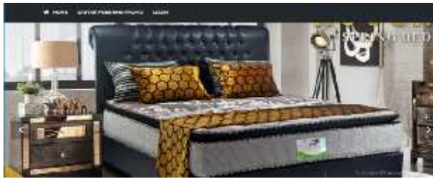
Gambar.1. Tampilan awal