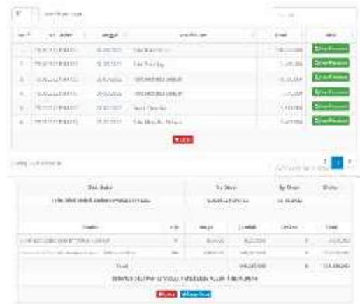
Gambar.12. Form Proses data penjualan

Dari gambar diatas menampilkan manfaat dari form proses data penjualan yaitu untuk view pesanan dari distributor setelah itu menambahkan produk beserta quantity lalu mencetak nota