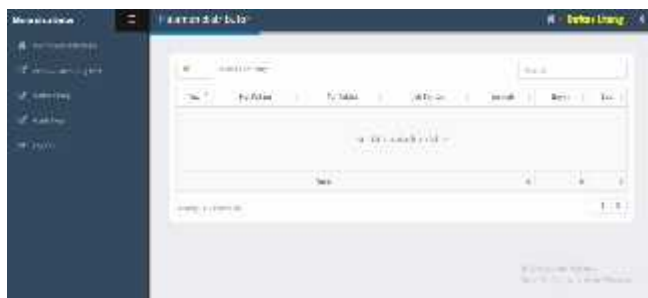
Gambar21. Form daftar utang

Dari gambar diatas menampilkan manfaat dari form daftar utang yaitu untuk menampilkan daftar utang setelah admin cetak nota