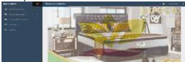
Gambar.3. Tampilan form menu admin

Tampilan menu admin merupakan tampilan awal setelah login sebagai admin. Dari gambar diatas terlihat beberapa menu dimana diantaranya adalah