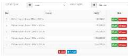
Gambar.9. Form produk Spring Bed

Dari gambar diatas menampilkan manfaat dari form produk Spring Bed yaitu untuk menghapus, menambah dan mengedit data produk Spring Bed .