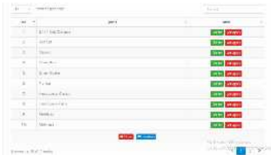
Gambar.8. Form jenis Spring Bed

Dari gambar diatas menampilkan manfaat dari form jenis Spring Bed yaitu untuk menghapus, menambah dan mengedit data jenis Spring Bed