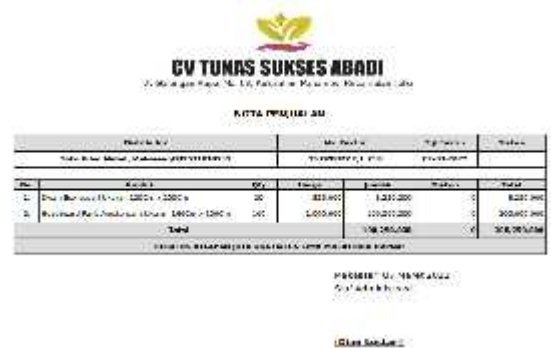
Gambar.13. Out put nota penjualan