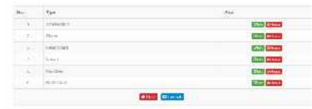
Gambar.7. Form tipe Spring Bed

Dari gambar diatas menampilkan manfaat dari form tipe Spring Bed yaitu untuk menghapus, menambah dan mengedit data tipe Spring Bed