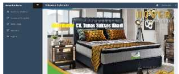
Gambar 19. Tampilan menu distributor

Tampilan menu distributor merupakan tampilan awal setelah login sebagai distributor. Dari gambar diatas terlihat beberapa menu dimana diantaranya adalah